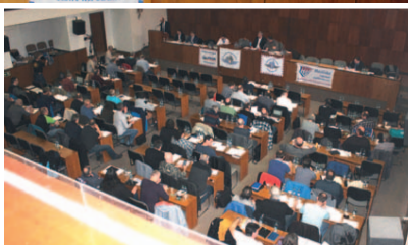
Zasedací sál „Přítomnost“ Domu odborových svazů v Praze na Žižkově, kde se letos konalo vrcholné výroční jednání naší samostatné profesní odborové organizace. Sedmašedesát delegátů zastupujících základní organizace Federace strojvůdců z celé České republiky nejen zhodnotilo uplynulé roční období, ale také projednalo a přijalo několik důležitých dokumentů, z nichž bude FSČR vycházet ve své další činnosti v roce 2018