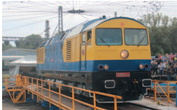
Na velké točce českobudějovického SOKV se v rámci oslav letošního Národního dne železnice představil i „Kyklop“ T499.0002. Z mnoha dalších zde prezentovaných historických vozidel jsou na druhém snímku zachyceny parní lokomotivy – zleva 310.23, 534.0323 a 525.101, kterou zprovoznil kolegové ze Společnosti železniční – výtopny Veselí nad Moravou. Blíže k tomu v článku na straně 2.

Jiří Šafařík, kandidát FSČR ve volbách do dozorčí rady ČD Cargo