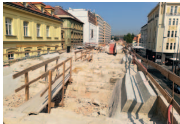
Dva pohledy na staveniště historicky mimořádně cenného Negrelliho viaduktu v Praze.

Přidejte se k více než 46 000 zaměstnancům a jejich rodinám ve VPN Family a ušetříte i Vy!