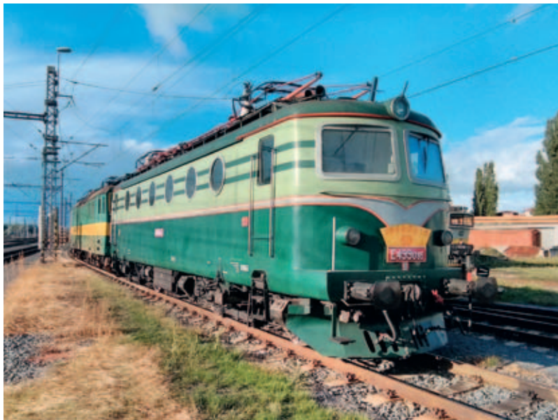
Ukončení výroby „mulkových Bobin“ před šedesáti lety nám připomíná i tento nápis na muzejní E499.085 v Olomouci. Přes svůj věk však lokomotivy této řady stále potkáváme na traťových výkonech soukromých dopravců v nákladní dopravě. Text a foto: Evžen Míkolajek