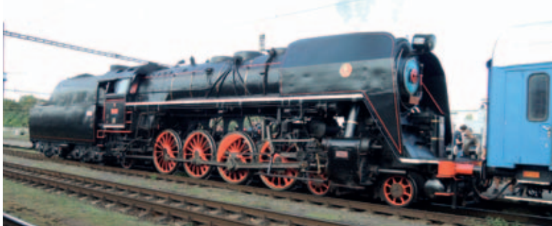
Nablýskaná děčínská „Pětasedma“ 475.179, čekající 28. září v čele zvláštního vlaku Sp 10064 ze soupravou čtyřdveřových vozů Bai na odjezd ve směru Lysá nad Labem, Stará Boleslav. Odjízď měla tendrem vpřed.