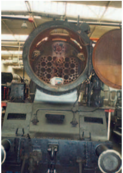
Dýmiční trubkovnice lokomotivy 433.001 bez přehřívací komory. Na záběru lze vidět otvory pro kouřovky, žárnice a komunikační rouru

– a to až doposud. První akce po znovuzprovoznění byla jízda do Skalice n/Svit. při 140. výročí trati Brno–Česká Třebová roku 1989.