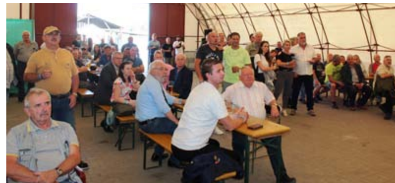
Účastníci slavnostního setkání v České Třebové na premiéře filmu k 125. výročí naší odborové organizovanosti. Na promítacím plátně je zaujala zajímavá exkurze do minulosti Federace strojvůdců, současné záběry pořízené v provozu, vyjádření funkcionářů FSCŘ, jednotlivých kolegů strojvedoucích a v neposlední řadě i partnerů naší odborové centrály, ministra dopravy K. Havlíčka, ale i mnoha dalších